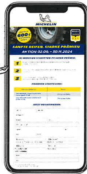
Abbildung und Inhalte ähnlich